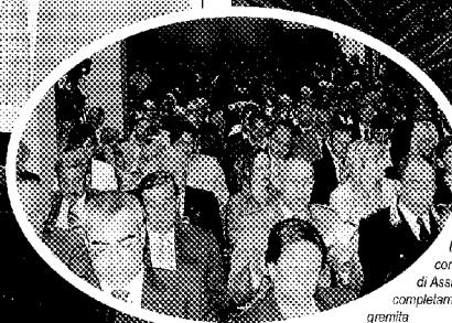
La sala congressi di Assindustria completamente gremita